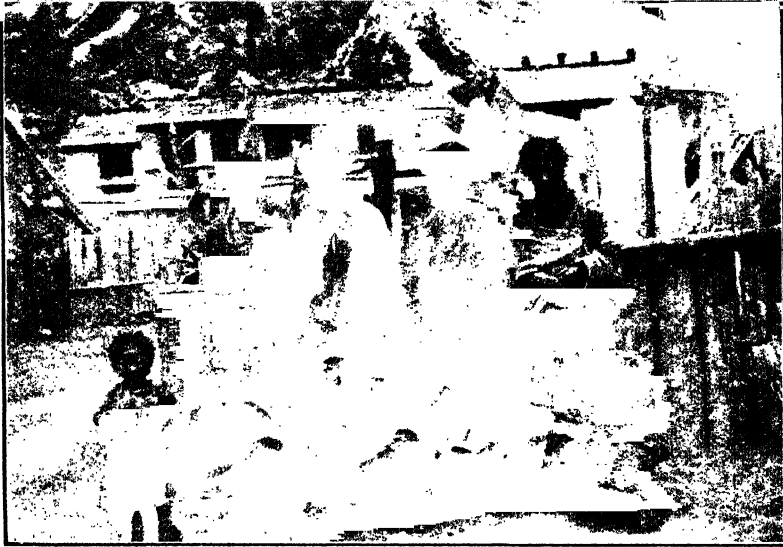
একটি তিব্বতী পরিবার

আজ ভোর থেকেই বৃষ্টি আরম্ভ হয়েছে। আমরা বর্ষাতি-গায়ে রওনা হলাম। কিছু দূর যাওয়ার পর এক দোকানে গিয়ে গরম দুধ কিনে দোকানদারকে জিগ্যেস করছি, দুধে জল মেশাওনি ত ? সে ত চটে বললে, “কী, আমি গরীব হতে পারি কিন্তু অধর্ম করে পয়সা নেব ?” দ্বিতীয় মহাযুদ্ধের সময় সপরিবারে এই লোকটা ব্রহ্মদেশ থেকে এসে এখানে বসবাস করছে। তার সততা দেখে ভারি